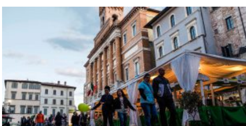
Primi d'Italia 2017: Foligno si prepara a mostrare il suo volto