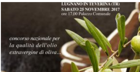
'Maratona dell'olio': trionfo d'autunno con Radio Subasio