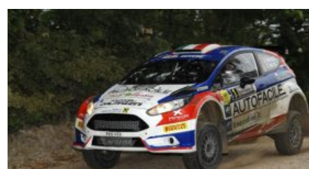
A Dalmazzini-Ciucci (Ford Fiesta R5) il Nido dell'Aquila 2017