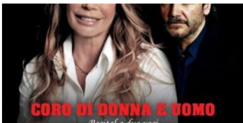
'Coro di donna e uomo Recital a due voci Maratona dell'Olio condanna la violenza