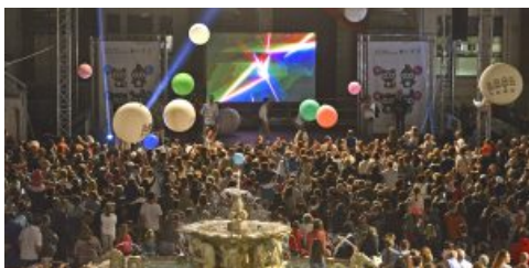
Radio Subasio regala la 1/2 Notte Bianca dei Bambini. Gioca a 'Indovina la canzone'