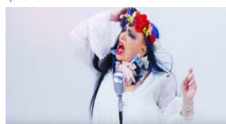
Musica per i Borghi prosegue ... ed intanto si attende Loredana Bertè

This website uses cookies to improve your experience. We'll assume you're ok with this, but you can opt-out if you wish.