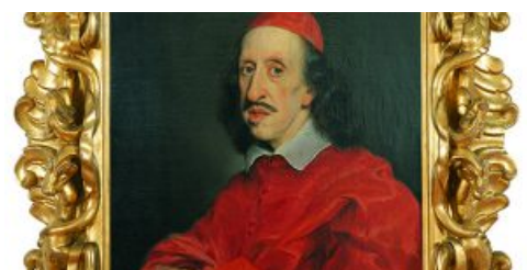
Mostre: a Firenze 'Leopoldo de' Medici principe dei collezionisti'. Radio Subasio c'è