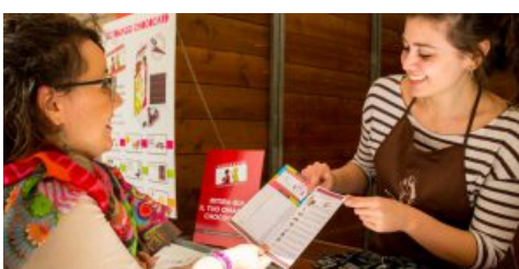
Eurochocolate 2017: con la ChocoCard ... ed anche con Radio Subasio è Tutta un'altra musica