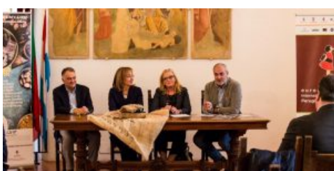
Eurochocolate: nasce la Choco Academy per i cioccolatieri del futuro