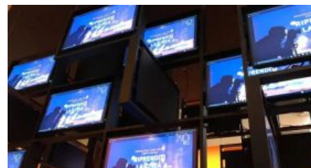
Torna "Riprenditi la città, Riprendi la luce", video concorso per giovani di AIDI. Anche Radio Subasio c'è