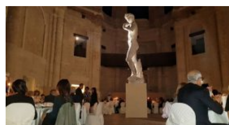
Primi d'Italia: si apre il sipario sulla XIX edizione