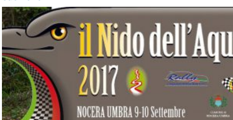
Quarta edizione de il 'Nido dell'Aquila'. Il 9 e 10 settembre Nocera Umbra capitale del Rally