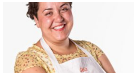
Fiera del Tartufo di Acqualagna: verso il gran finale Radio Subasio c'è