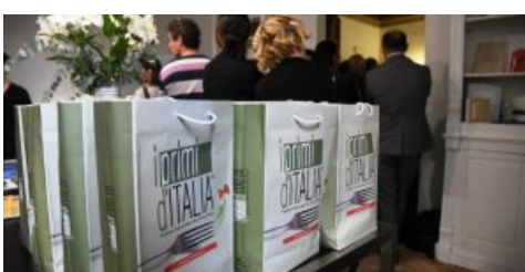
Primi d'Italia, pronti con la XIX edizione. Parola d'ordine, eccellenza!