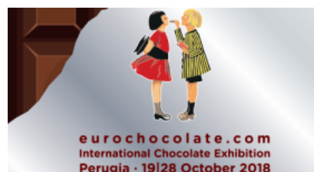
Eurochocolate 2017: presenze in aumento