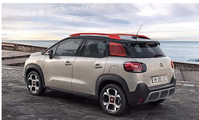
Scopri il Nuovo Suv Citroën C3 Aircross, con Grip Control e Hill Assist Descent (Citroën)