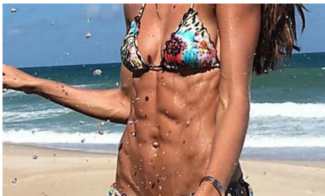
Ecco come bruciare davvero il grasso addominale