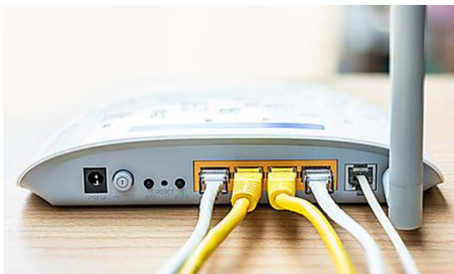
Attivazione Internet senza Telefono Cerca le Migliori Offerte (Natifly)