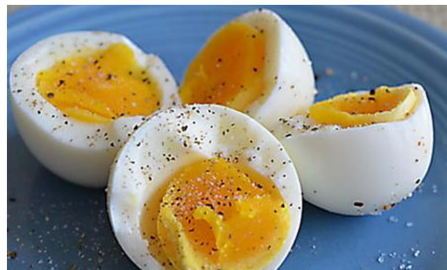
15 Trucchi e rimedi della nonna per dimagrire in fretta (La Casa Facile)